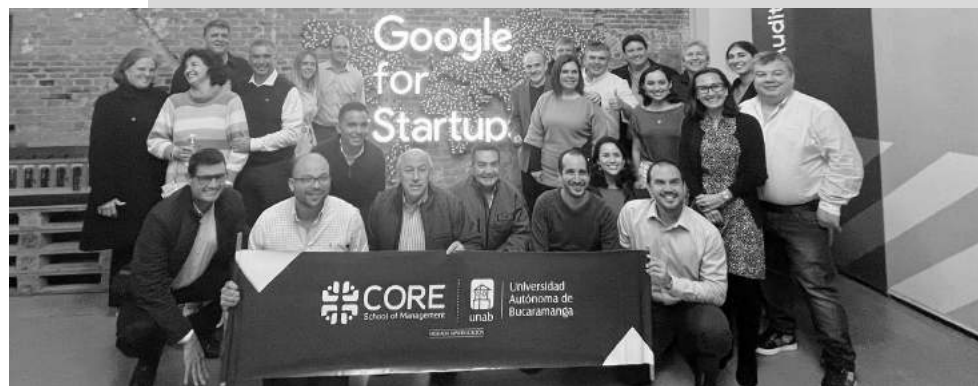
ALUMNOS PARTICIPANTES EN PROGRAMAS ANTERIORES